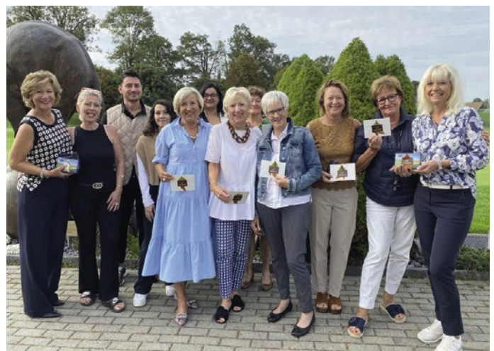
Amante Coiffure – Gewinnerinnen und Preisbrechtigte.