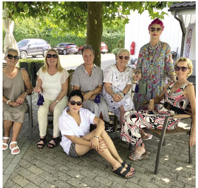
Runde Geburtstage - Gewinnerinnen und Preisbrechtigte.