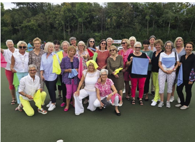
Rund ums Hus.