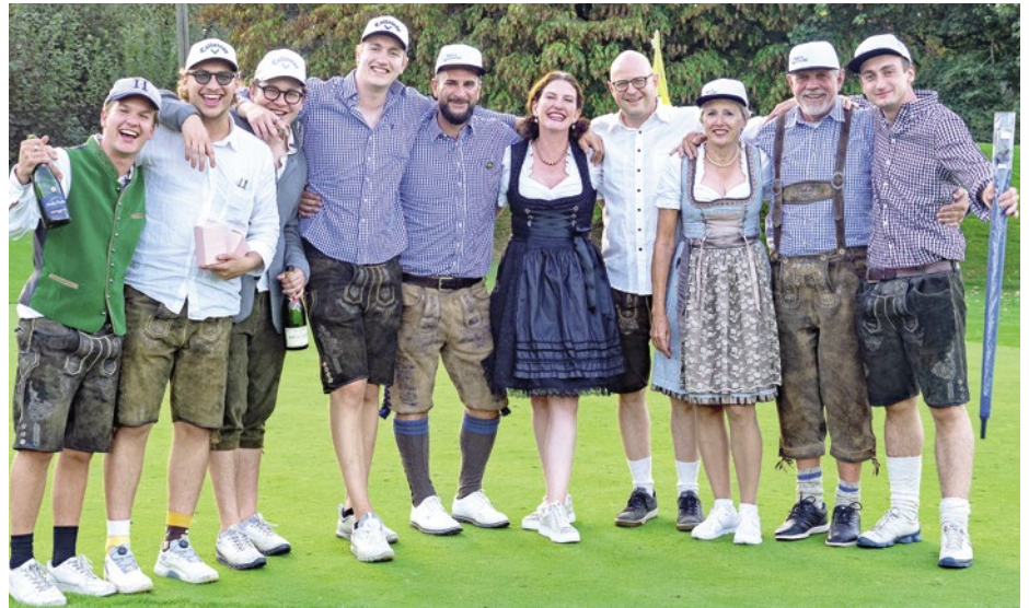
Oktoberfest-Turnier - Gewinner und Erstplatzierte.