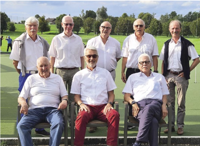
Crèmeschittenturnier – Gewinner und Preisberechtigte.