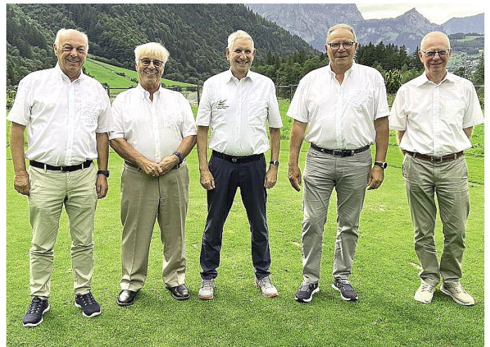
Turnier Engelberg - Gewinner und Preisberechtigte.