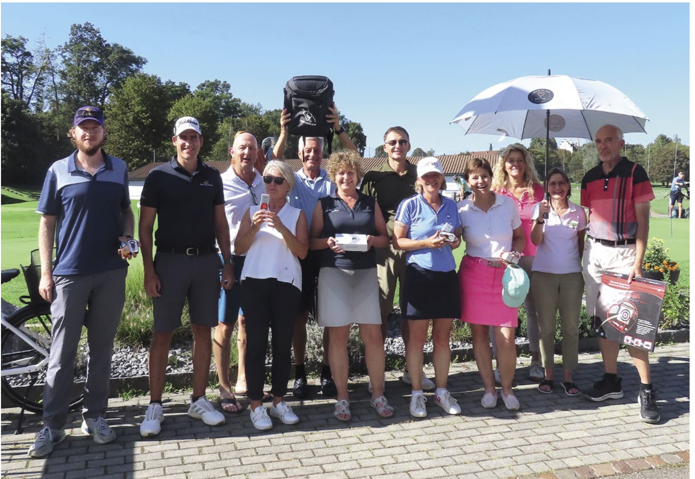
Zadotti-Cup – Gewinner und Preisberechtigte.

Es wurden zwei Auswärtsbegegnungen und zwei Heimspiele ausgetragen. Im April hat uns der Golfclub Goldenberg empfangen und die Begegnung mit 6:3 für sich entschieden. Hier möchte ich aber erwähnen, dass es während des Turniers eine Zeit gab, in der es für Bubikon sehr gut zu laufen schien, dennoch konnte der GCB dies nicht bis am Ende durchhalten. Bei der zweiten Auswärtsbegegnung war der GCB zu Gast in der Lenzerhei-