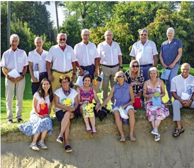
Mixed Scramble – GewinnerInnen und Preisbrechtigte.