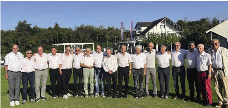
Turnier Runde Geburtstage – Gewinner und Preisberechtigte.