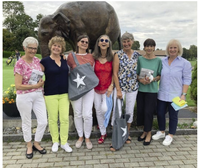
Rund ums Hus – Gewinnerinnen und Preisbrechtigte.