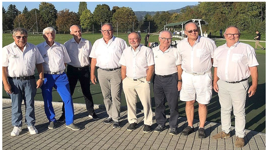
Turnier Season End – Gewinner und Preisberechtigte.